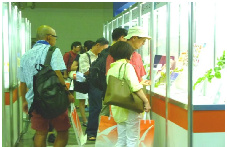
株主優待展示コーナー