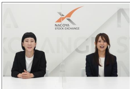
名証内のホールなどで撮影

名大社の就活アドバイザーがインタビュー形式で採用担当者から企業の魅力を学生目線で引き出す