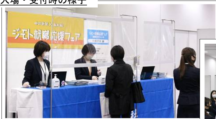
感染防止対策を施した入場・受付