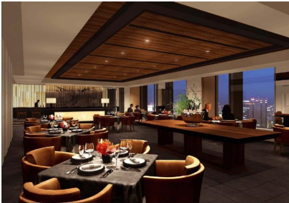
ダイニングルーム