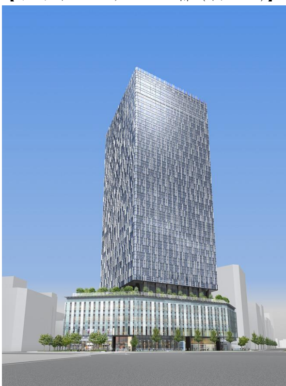
大名古屋ビルヂング