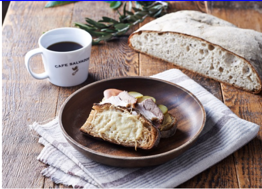
キューバクロック