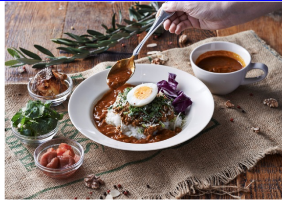
Salvador カレー(トッピングは別途)