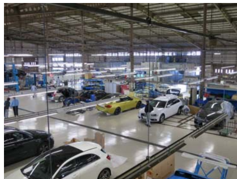
<ヤナセオートシステムズ 内製工場の風景>

全国8か所にあるコントロールセンターでは、全国9か所にある内製工場、協力工場と提携し、事故車修理を全国統一ルールに基づいて集中管理し、修理車両の受け入れ手配、見積書の作成、工場への作業指示、依頼元への案内などを一手に行っております。また、同センターでは協力工場の選定・管理や技術トレーニングを実施し、各工場の品質管理の徹底、生産性向上を図っています。