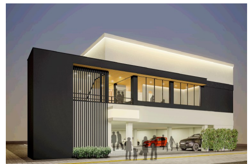
※木曽路熊谷店イメージ画像です

店舗名 : しゃぶしゃぶ・日本料理 木曽路熊谷店 開店日 : 2019年1月23日(水) 所在地 : 埼玉県熊谷市本町一丁目77番地 営業時間 : <平日・土曜>11:30~15:00 (L O14:30) 17:00~22:00 (L O21:00) <日曜・祝日>11:30~22:00 (L O21:00) 定休日 : 年中無休 席数 : 144席